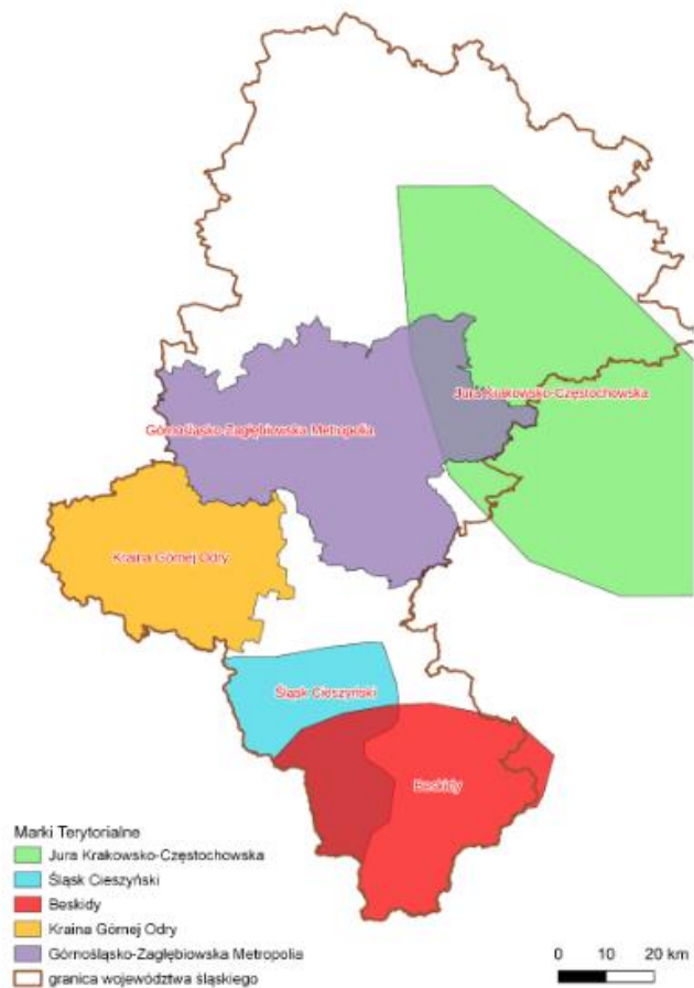
Rysunek 9 Rdzienie obszarów marek terytorialnych województwa śląskiego